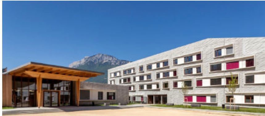
Internat et restauration